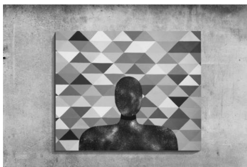
Рис. 4. Ринат Шазам «Иллюзия свободы». Холст, масло

Другая картина — «Иллюзия свободы» — своего рода перевертыш «Автопортрета»: заглянув внутрь себя, начав процесс собственного познания и увидев внутри безграничный космос возможностей, человек, тем не менее, остается во власти ограничений, накладываемых на него «рамками» его частной жизни и в целом, самим фактом существования в рамках физической оболочки. Осознание этого как будто перемещает черную повязку с человеческих глаз на картине «Автопортрет» на шею, превращая слепоту ограниченного знания в душачий ошейник мировоззрения материализма. Игра смыслами между полюсами философии материализма и идеализма, метания между миром духа и материи придают творчеству Рината Шазам напряженность и драматизм.