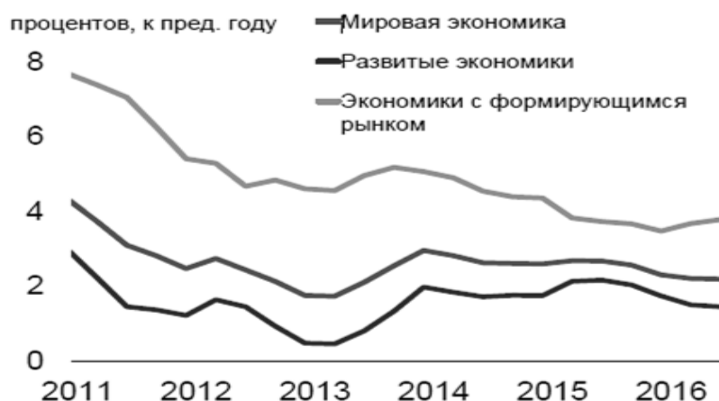
Рис. 1. Замедление темпов роста мировой экономики

В настоящее время, как мировая экономика в целом, так и Российская, переживают период рецессии или стагнации (рис. 1 и рис. 2) [1].